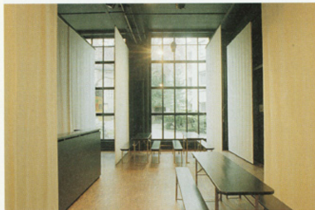
Mit an Sofflitten erinnernde Stoffbahnen lässt sich der Theaterraum unterteilen