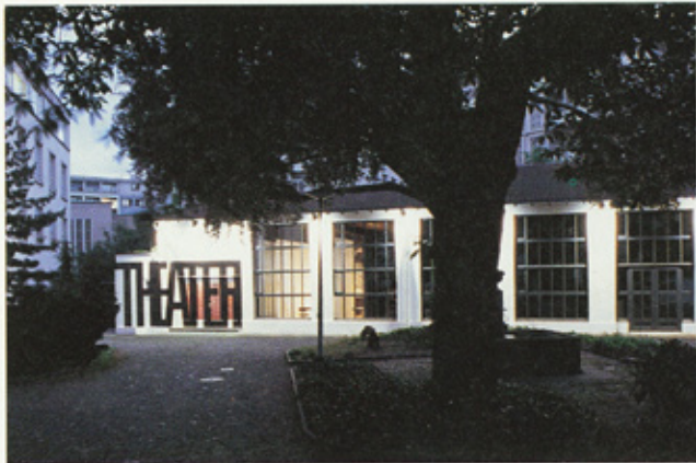
Der idyllische Hof mit grossem Baum