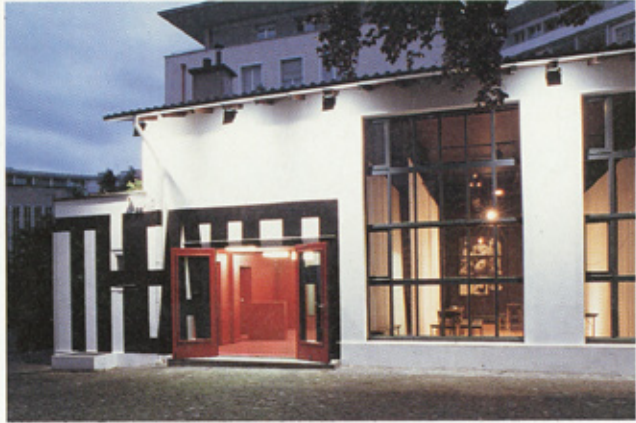
Das Rot des Eingangs lockt die Besucher an

nenvorhang. Er leitet von der realen Welt ins Spiel über.