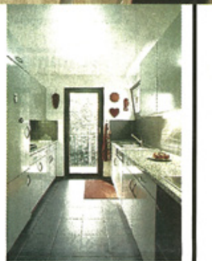
Die Himmelsrichtungen und die Umgebung im Griff: Im Norden gegen die Strasse liegt die Küche, gegen Süden und Westen Wohn- und Essbereich.

Wer durch eine der Wohnungen streift, merkt schnell, wie präzise die Fenster gesetzt sind: Tageslicht fällt überall dort ein, wo es gebraucht wird, etwa im Korridor zwischen dem Treppenhauerkern und den Schlafzimmern. Ausblicke werden dort geschaffen, wo sie spannend sind, etwa nach Süden über den Fluss und die Altstadt oder nach